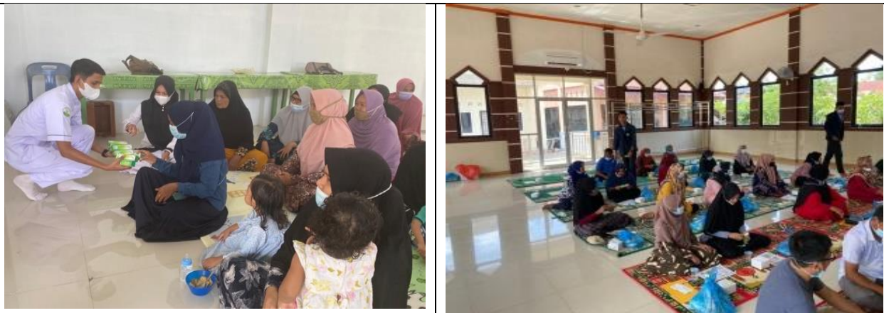
Gambar 6. Pembagian Pasta gigi Herbal ekstrak metanol daun laban kepada kader PKK