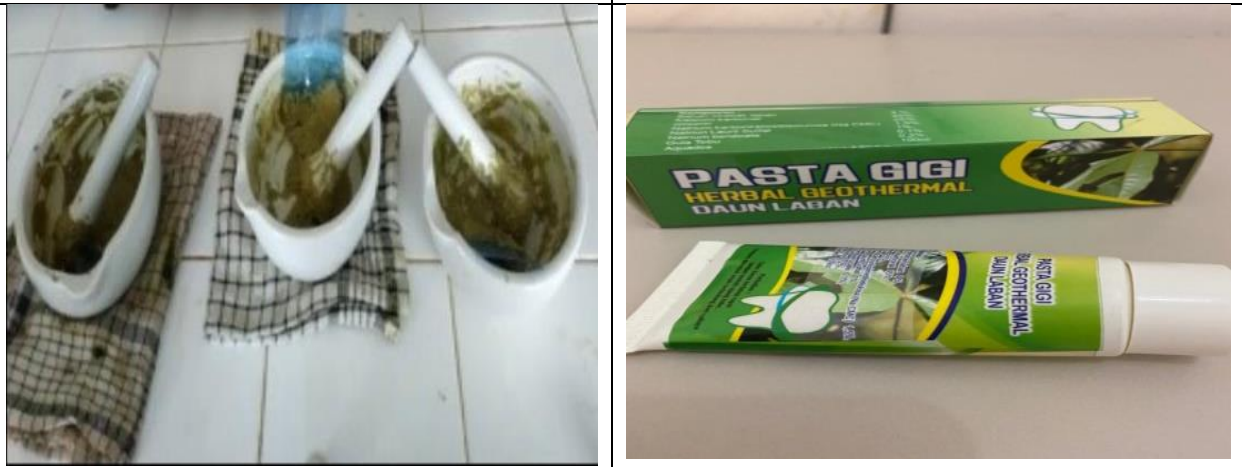
Gambar 5. Proses Pembuatan Pasta Gigi Herbal