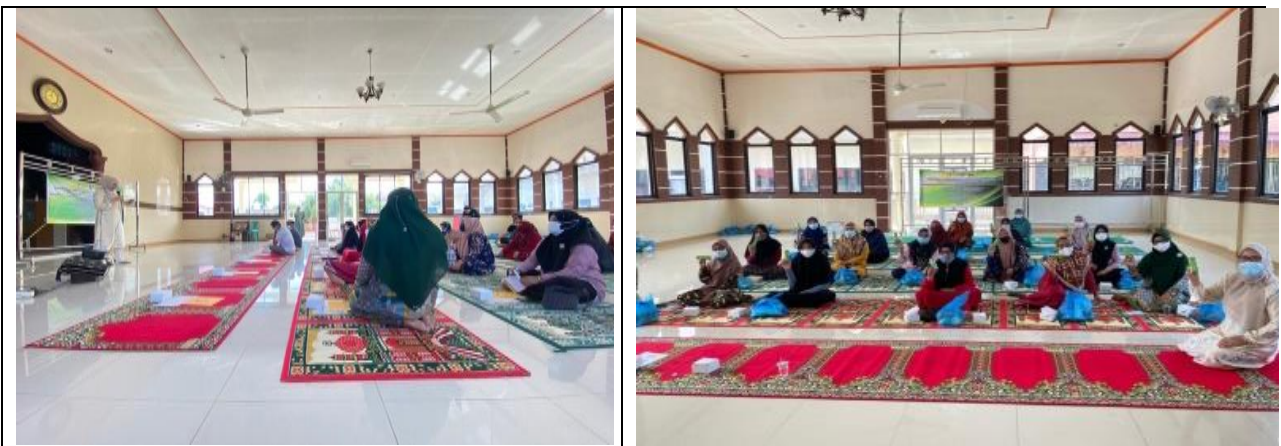
Gambar 3. Penyuluhan upaya penurunan indeks plak gigi

Seluruh bagian tumbuhan laban dapat dimanfaatkan untuk pengobatan penyakit, daun untuk mengobati demam, hipertensi, dan kulit batang untuk mengobati luka, sakit perut dan disentri, sedangkan akar sebagai minuman teh yang dapat menghilangkan kelelahan, sakit pinggang dan sakit tubuh. Hasil uji fitokimia kawasan Geothermal Selawah Agam, Aceh Besar menunjukkan bahwa ekstrak metanol daun laban mengandung, alkaloid, flavonoid, saponin, sterpenoid, tanin, dan kulit batang mengandung, alkaloid, safonin, tripernoid dan tannin. Sementara ekstrak senyawa dari laban memiliki aktivitas anti mikroba, anti inflamasi, anti diabétes, antioksidan, antitumor, anti jamur, dan antibakteri. (Nuraskin et al., 2021).