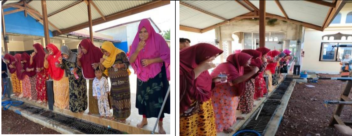
Gambar 7. Sikat Gigi massal Kader PKK menggunakan pasta gigi herbal ekstrak metanol daun laban